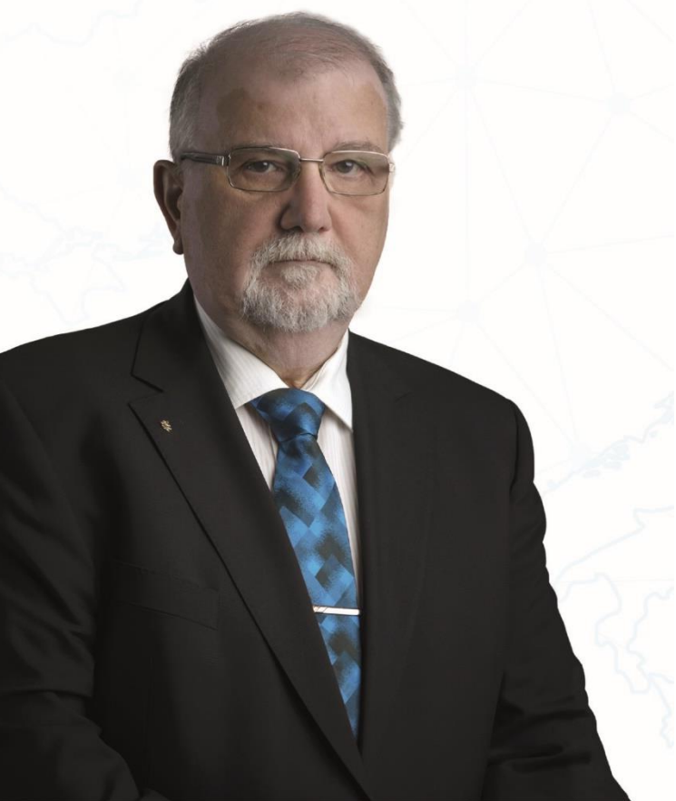
Jaroslav Hanák Prezident Svazu průmyslu a dopravy ČR

Čeká nás ale ještě dlouhá cesta. Je dobře, že se na ní můžeme opřít o sílu více než 30 členských svazů a asociací a více než stovky nejvýznamnějších českých firem, které jsou přímými členy Svazu průmyslu. Společně můžeme Česko změnit k lepšímu.