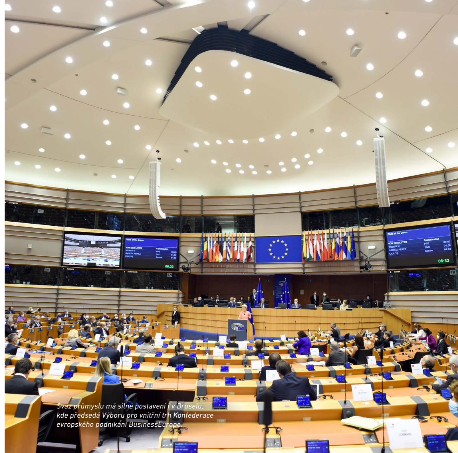
Svaz průmyslu má silné postavení i v Bruselu, kde předsedá Výboru pro vnitřní trh Konfederace evropského podnikání BusinessEurope.

S europoslanci a pracovníky Stálého zastoupení ČR při EU spolupracujeme prostřednictvím České podnikatelské reprezentace při EU (CEBRE), kterou jsme spoluzakládali.