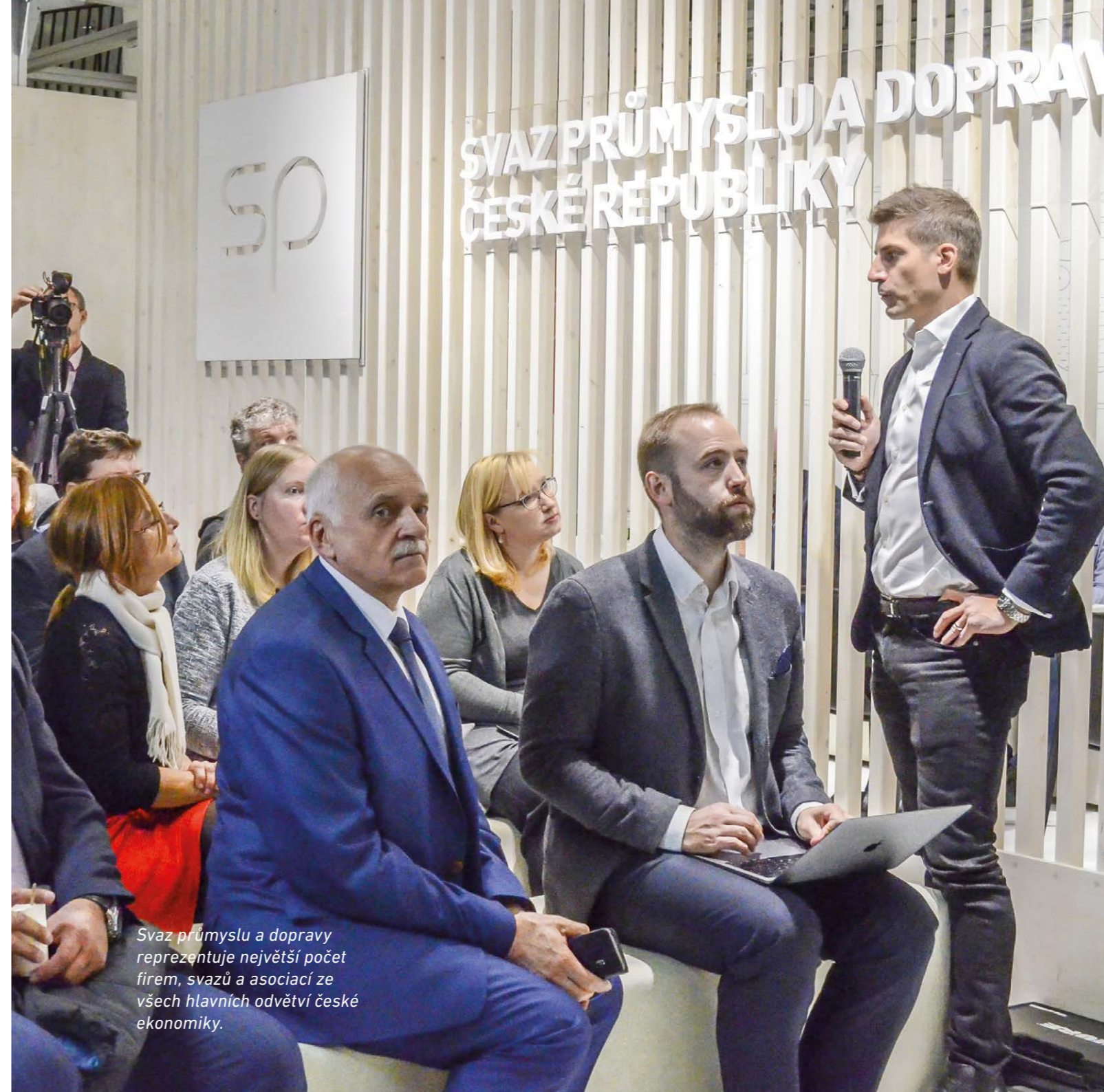
Svaz průmyslu a dopravy reprezentuje největší počet firem, svazů a asociací ze všech hlavních odvětví české ekonomiky.